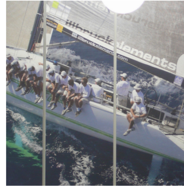
Stand der Herstellerangaben: 03/2026. Technische Änderungen vorbehalten.

Mit Artwork Polar kommt ein sortenreines, recyclingfähiges Akustikelement aus 100% Polyester zum Einsatz, das im umweltfreundlichen Verfahren ohne chemische Zusätze und ohne Bindemittel gefertigt, mineralfaserfrei, toxisch unbedenklich, hautsympathisch und allergikerfreundlich ist.